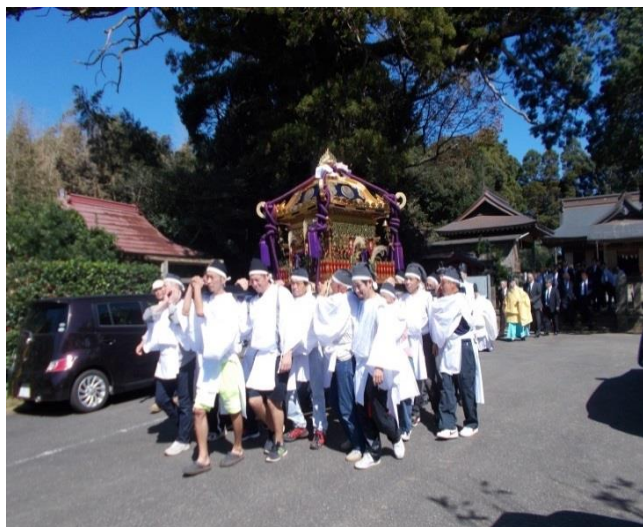
各地区昇夫の神輿