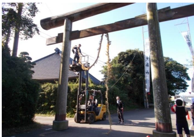
大鳥居の大しめ縄の取付