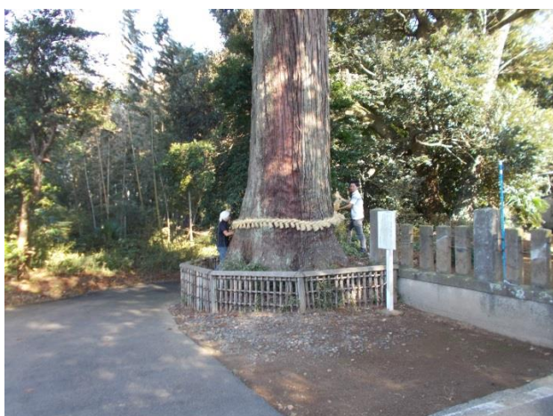
大杉の大しめ縄の取付

当社では、例年、例大祭にあわせて大鳥居及び御神木の杉の大しめ縄の掛け替えが行われます。