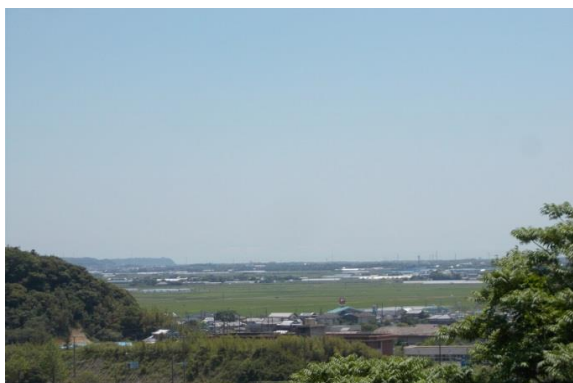
見晴らし処からの風景

当社右奥農村公園の奥に歩いて行くと、県東総運動場を正面に見渡せる場所があります。