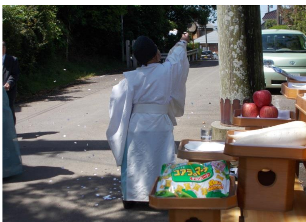
大鳥居建て替え起工式祭典