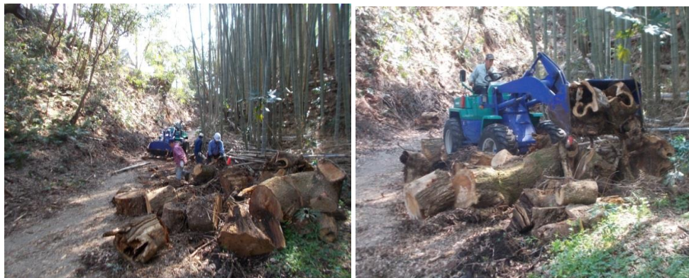
神社側道倒木整理（重機提供吉原重機様）

4月4日（土）前年の台風15号により被害により御手洗への神社側道の倒木を搬出の可能な大きさに裁断をし、道路の通行に不便の無いように片付けを実施し今後の後片付けを容易に出来るようにしました。