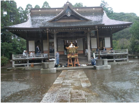
拝殿前に奉安した御神輿

例大祭は、毎年、神社庁から献幣使をお迎えして行われる神事で、卯年の御神幸祭のように、行列を組み、各区代表の舁夫による御神輿を中心に鳥居地先まで御神幸します。