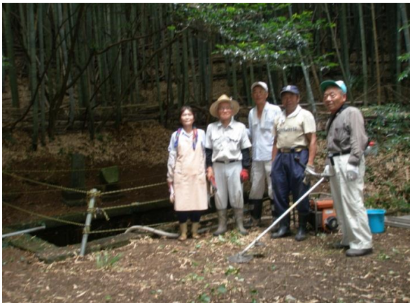
宮本区御井戸払い奉さん会の皆さん

7月26日（土）、宮本区の御井戸払い奉さん会の皆さんにより御手洗の清掃をしていただきました。