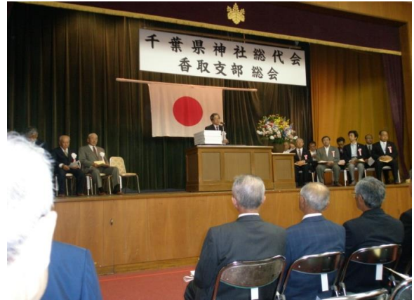
千葉県神社総代会香取支部総会

総会は、国会議員・県議会議員等多数の来賓をお迎えし、祝辞を頂いた後、議事に入り、25年度決算、26年度予算等予定された議案が承認され、閉会しました。